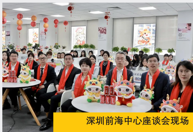
深圳前海中心座谈会现场