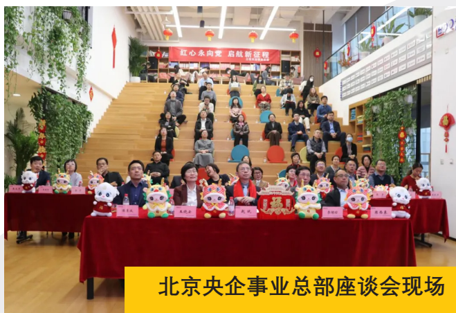
北京央企事业总部座谈会现场