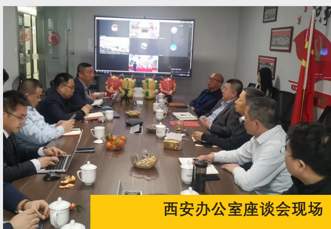
西安办公室座谈会现场